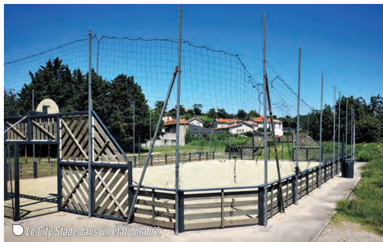
Le City Stade dans un état délabré.

Durant ces 2 semaines, 12 jeunes ont pu rénover et repeindre le city stade du quartier Clairval mais également de repeindre 5 salles/bureaux du centre social municipal Rosa Parks. Ils ont pu également rafraîchir les jardinières sur le quartier Clairval.