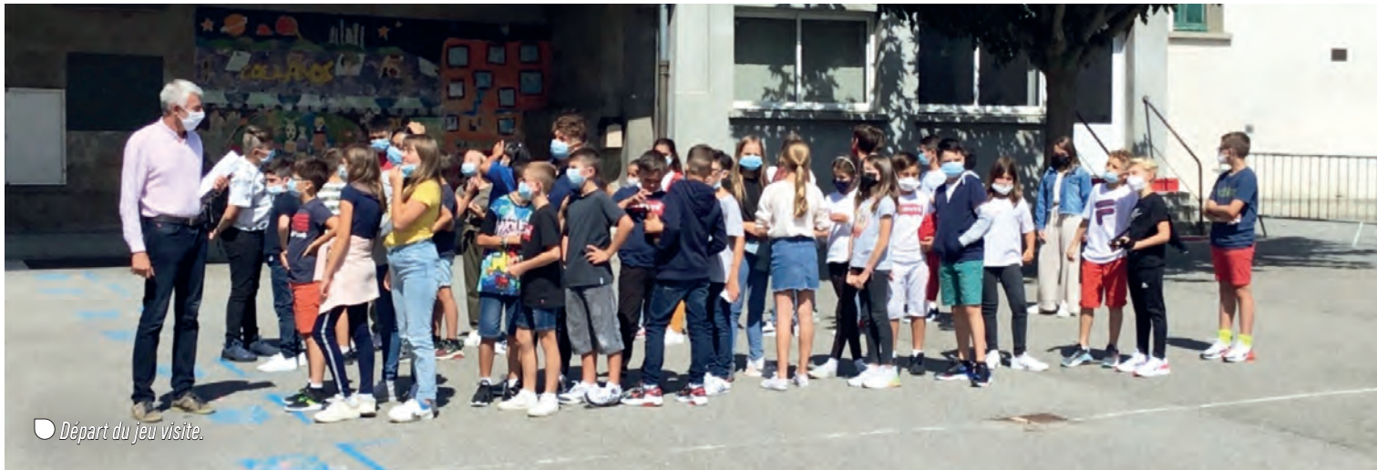
○ Départ du jeu visite.