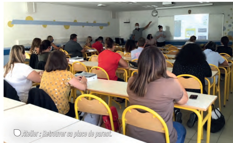
○ Atelier : Retrouver sa place de parent.

Une journée bien remplie, riche en émotions... un grand moment de partage et d'échanges, très appréciée de tous : équipe éducative, parents et élèves.