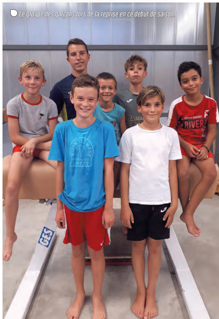
Le groupe des garçons lors de la reprise en ce début de saison.