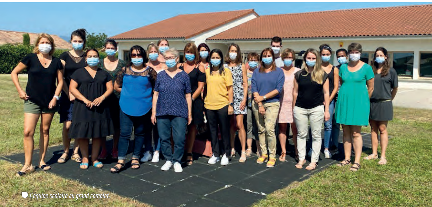
● L'équipe scolaire au grand complet.