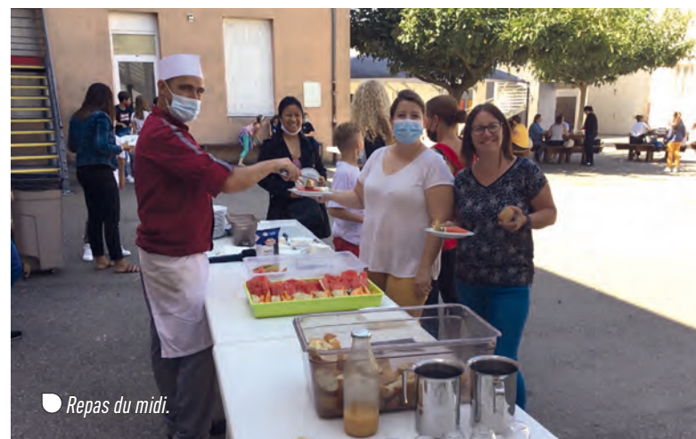
○ Repas du midi.